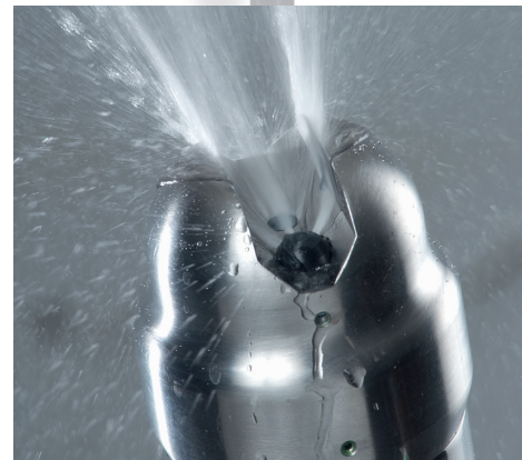
自动冲洗装置无移动部件，可确保将维护量降至最低并提升可靠性。冲洗喷嘴使用水或压缩空气。