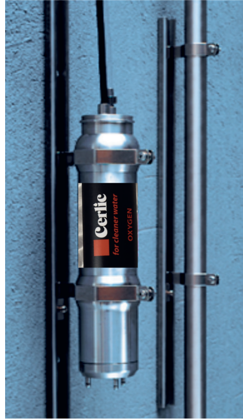
SS 滑轨组件便于安装和维修。提供两种可用尺寸：20 mm 适用于 pHX、ReX 和 FLX，66 mm 适用于 O2X 及 ITX 传感器。滑轨上有现场可调止块。在清洁及校准时，可轻松安装及检查传感器。