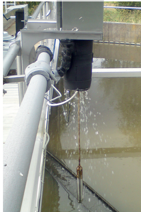
CBX 随附配有一个带 SS 滑轨安装组件的不锈钢壳体，可便捷安装至滑轨上。每个周期后线缆和传感器自动水冲洗系统。