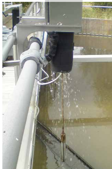
CBX 随附配有一个带 SS 滑轨安装组件的不锈钢壳体，可便捷安装至滑轨上。每个周期后线缆和传感器自动水冲洗系统。