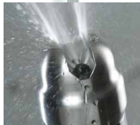
自动冲洗装置无移动部件，可确保将维护量降至最低并提升可靠性。冲洗喷嘴使用水或压缩空气。