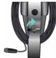
Enkelt att byta givare