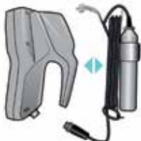
Handenhet Givare med kabel