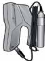
Givare monterad på handenhet