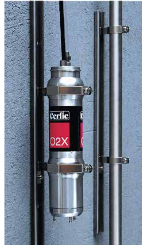
En justerbar skenarmatur gör det möjligt att placera givarna med hög precision mot vattennivån eller annan nollpunkt. Det är lätt att montera eller demontera givarna vid inspektion, rengöring eller kalibrering.