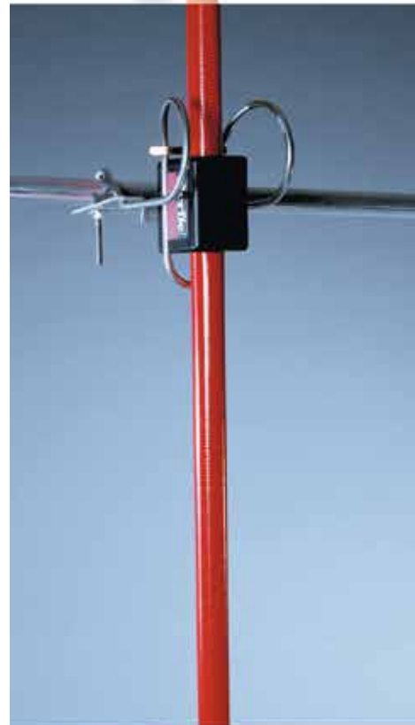
En fjädrande räckeshållare med en teleskoparmatur som kan dras ut från 1,5 till 4 meter, ger ett starkt och smidigt montage som parerar stötar och skonar både räcke och givare.